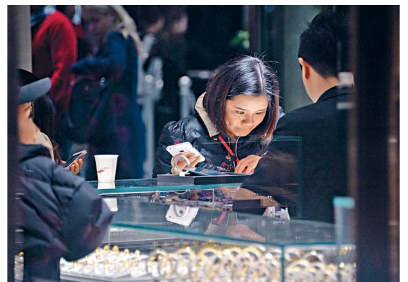
■要提升服務品質，企業應要定期進行員工培訓。

香港商界愈來愈重視企業社會責任，社會對企業的期望也更高，企業能通過策略履行社會責任，可從員工培訓、環境保護、售後服務、物業管理、義工服務及社會建設等方面入手，滿足不同持分者需要，在提高企業利益，亦兼顧提升品牌價值及公司聲譽，讓企業能享有可持續發展。